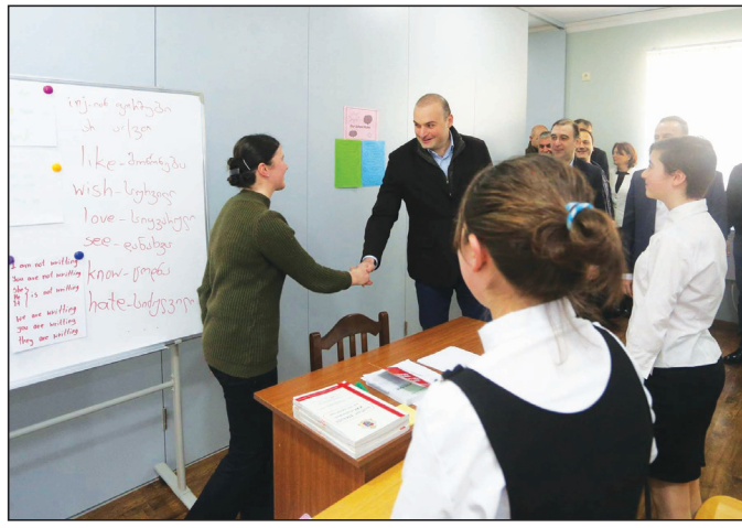
ოქეტი. გურიაში ჩვენ გვაქვს ითარების პარალელურად არის ადგილები, სადაც არის პრობლემა და ბუნებრივია, სკოლებისა და ბაღების განვუკა ბახტაძემ.

პრემიერ-მინისტრი ჩოხატაურის მუნიციპალიტეტის სოფელ შუა სურების ახალაშენებულ სკოლაში იმყოფებოდა, სადაც მოსწავლეებსა და პედაგოგებს შეხვდა. მამუკა ბახტაძე მათ განათლების რეფორმის შესახებ ესაუბრა და აღნიშნა, რომ მსგავსი თანამდროვე სტანდარტების სკოლები საქართველოს მასშტაბით აშენდება. მთავრობის მეთაურმა სოფლის ისტორიის მეთაურმა სკოლის მოსწავლეების მიერ მომზადებული პრეზენტაცია მოისმინა და ბავშვებს, მათ პედაგოგებსა და მშობლებს მადლობა გადაუხადა. პრემიერის თქმით, მსგავსი ნიჭიერი ახალგაზრდების მაქსიმალური ხელშეწყობა და მათი ნიჭის რეალიზაციის შესაძლებლობების გაჩენა მთავრობისთვის პრიორიტეტულია. „განათლების რეფორმა და ამ სფეროში ინვესტიციების განხორციელება არის ჩვენი მთავრობის მთავარი პრიორიტეტი. გურიაში რამდენიმე ახალი სკოლა შენდება. ამ სთან ერთად, არის რესურსი გამოთავისუფლებული, იმისთვის, რომ გავაორმაგოთ სკოლებისა და საბავშვო ბაღების მშენებლობა. ჩემი ინტენციის საგანია ინტერნეტიზაციის პრ-