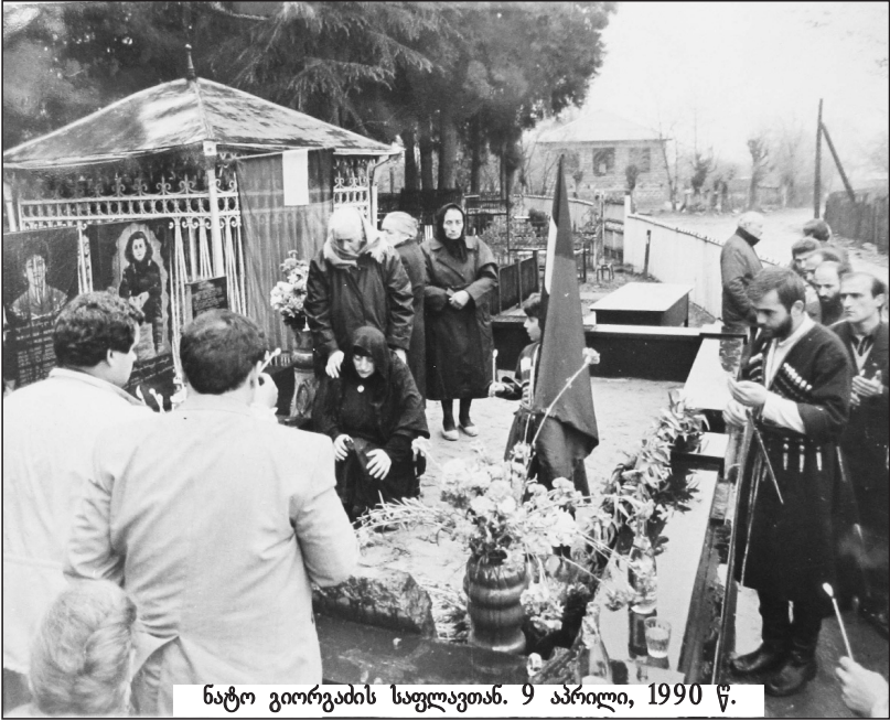
ნატო გიორგაძის საფლავთან. 9 აპრილი, 1990 წ.