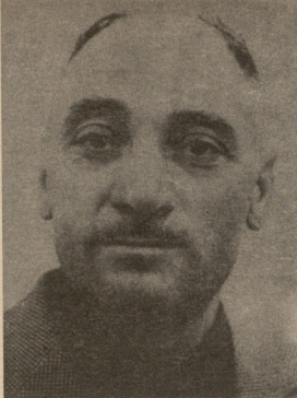
სის განხორციელებისათვის. რომლის მიზანია საბჭოთა ავიაციის კეთილდღეობა, კვეყნად შევიდეთ და დავდარბავ, ძმობა, მეგობრობა, ურთიერთობა-მშრომლობა.

დავიანის ცხოვრებაში არის განსაკუთრებული სიხარული აღსაყვ დღეები, რომლებიც არასდროს დავიწყებმა. კასის ცემენტის ქარხნის შიფერის წარმოების დამფორმებელი მანქანის შემანქანის შალვა ნატროშვილისათვის მიმდინარე წლის 17 მარტი ორშაბათ ღისშესანწევი იყო.