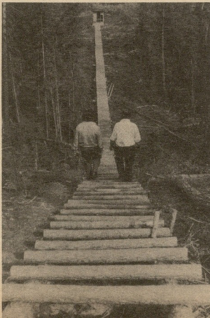
მდინარე ნიაზე ჩამავალი კიბე, რომლის სიგრძე 500 მეტრია.