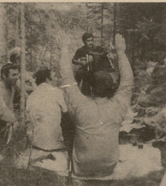
ნია-გრუხინსკია. მშენებლები ისვენებენ.