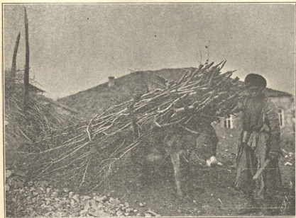
სურათი კახეთის ცხოვრებიდან.