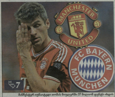
მანჩესტერ იუნაიტედი თმას მიულერში 37 მილიონ ფუნტს იხდის