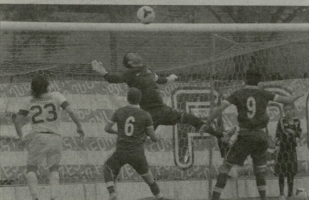
სესტაფონი-დინამოს მატჩში ასეთი მწვავე მომენტები მრავალად იყო