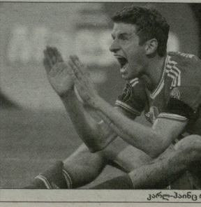
კალ-პანტი რუმენიგე თომას მიულერი კაპინგეტანი დაიბარა

„პაიორნის“ რომელიმე ფუნქციონალი უკმაყოფილო და თავს ცუდდ ვერძობს, ჩემს კაპინგეტან უნდა შემოვიღას! უნდა ვერძობას „კაპინგეტონი“ აღსანიშნავია, რომ მანჩესტერულს მიულერის დადებითად მარხავსაც სურდათ. „მიულერი ისეთი მოიაზრება, რომელიც „სოლიდოსის ნებისმიერ