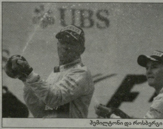
ჰემილტონი და როსბერგი

ბრძოლებმა ბოლო სამი რაუნდი გაიარეს, თუმცა საბრძოლო კინამა დათბო ლიდერობა, როცა თანაგუნდელისგან უფლები ზეწოლა იცემდა. მანის ლუისმა აღიარა ისინარფეში ნიკოს უპირატესობა, მაგრამ უკვე მომდევნო ტრაშუ-ჩინეთის გრანპრის დღის მსოფლიოს 2008 წლის ჩემპიონი ერთი თავით მაღლა იდგა გერმანულზე.