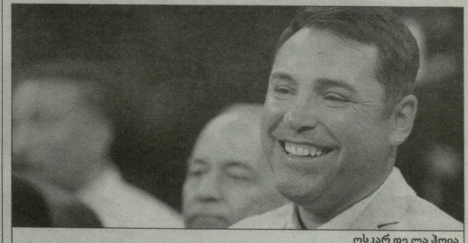
ოსკარ დე ლა პოია