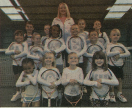
ელენა ბალტაჩა თავის პატარა შეიარაღებულ თევზად