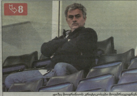
ფოზე მორინოს კრიტიკოსები მოუმრავლდნენ