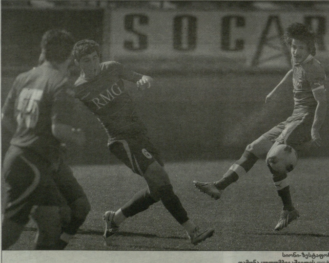
სპორტი-ვენსპილი თამუნა ყულუმგაშვილის ფოტო

1:0 გოგობერიძე (33), 1:1 გენაძე (33), 2:1 გოგობერიძე (75-86) სპორტი (4-2-3-1): მერღანი - დ. ფოხვაძე, აბრამიძე, სვანიძე, თითაძე - იმედაშვილი, ცხადაია - ზ. ზორბაძე (90, კანდელაკი), გოგობერიძე, სამარაძე (82, ვარლამი) - კახიანიძე (82, ვ. ვარლამი). საქართველოს მთავრობის მიერ დანიშნული, ელემენტი, ვაჩია, მამაზაშვილი მწიფე მწიფე ლდი ბურჯული ზაბთაშვილი (4-2-3-1): პავლიანი - დელიჯი გრავალაშვილი, რეზაგაძე, ზ. მელიძე, ბ. გურული - შარბიძე, ქანკიაძე (77, კახანიძე) - ფლოძე (70, დანცვალია), ქანტარიაშვილი, გენაძე - ტატაშვილი (84, ხანაძე). საქართველოს მთავრობის მიერ დანიშნული, ელემენტი, ვაჩია, მამაზაშვილი მწიფე მწიფე იმედაშვილი (41), მარიძე (74), თითაძე (88) არბიტრი: ბ. გენაძე