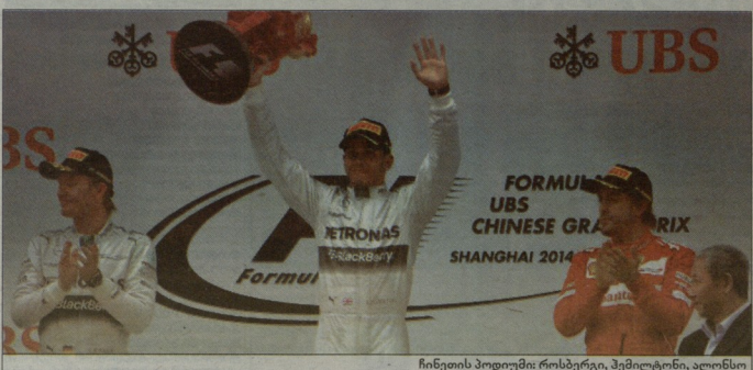
ჩინეთის პოლემი: როსბერგი, შუბმენთი, ალინსი