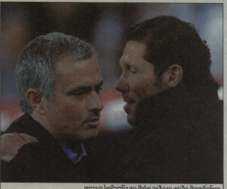
დიეგო სიმენს და მისი ვიჯიტი ფოზე მოურინი

მიღწევა იქამდე მდგრადდება ვერო- ბული ფეხბურთის კიდევ ერთი გრანდი „ჩელოსი“ დასაგრეს, ხოლო ლონდონე- ლური ძალის ადგილად გაუმჯობესდნენ „ავალიანსარისი“. ახლა კი, როდესაც ფინანსურად ერთი ნაბიჯი წინაა, ეს ორი უაღრესად ორგანიზებული გუნდი ერთ- მანეთს დაუპირისპირდება. ფოზე მოუ- რინი ს დარ გამოცდილი სპეციალისტს არ ესნაფდება, თუ რამდენად ფასობს შეტოვის მოედანზე გატანილი გოლი, ამის მავალითად თუნდაც იგივე მი- მის დაპირისპირება გამოდგება. ამი- ტომაც, პორტუგალი სპეციალისტი საკუთარი კარს უსაფრთხოების გარდა, ყველაწარად ვეფლება, რომ მის ფუნქს გული გაატარებინოს აუტენტუ კლდერონ- ზე, გული, რომელმაც საბოლოოდ შე- საძლია, ად ლუქზე“ გასამგზავრებული საგზურის ბედი გადაწყვიტოს. დიეგო პალო სიმენს კი უფრო ახალი თაობის, მაგრამ უკვე არანაკლებ პოპულარული მწვრთნელია. „ჩელოსი“ დაახლოებით იმ გზას ადგას, რომელიც მოურინომ თავის დროზე „პორტუსთან“ ერთად გაიარა. მისი „აოლტეტი“ იდეებულად გამოიყურებთან და როდესაც რამდენიმე ფეხბურთელი აკლიათ, თუნდაც დიე- გო კომტას ფასის, მაშინაც კი ისეთივე შეპირებით თამაშობენ, როგორც ყო- ველთვის და როგორც ეს მათ სიმენსებ ამნაულა.