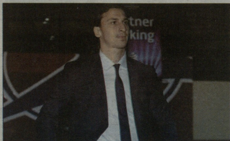
ზღაგან იბრაჰიმოვიჩი ძმის გარდაცვალების გამო შეფელში გაემგზავრა

ტურქი მონპელიემ დრამატულმა და უბედოლოდ მოუძღვა ხანსა. ადგილობრივი გუნდი ორჯერ აგებდა „მარსელთან“ და ორჯერ გაათავანბრა, მაგრამ 89-ე წუთზე შეცვალა შესულმა დამცვერი პაიეტ მესამე გაიტანა და ფოზე ანდრეს გუნდმა საჭირო სამი ტულა მოიპოვა. ფაქტობრივად გააანადგურა ვინ დატოვებს ლიგა 1-ს. გალანსიტინმა „ოლივან“ ნაყო, რენე ვირანოს ისევ მძიმედ, მაგრამ კვლავაც მოიგო და მესამე ადგილზე მყარად დარჩა. შეხვედრის ერთადერთი გოლი დიეგო ორივიმ გაიტანა. შეცვალა ზესულს 18 წლის ბელგიელისთვის ეს სეზონში მე-5 გოლი იყო, რაც პრინციპულად შედეგად ახალგაზრდა ტლანტისთვის. „გალანსიტინ“ გადაასრებს - „სიმი“ გასვალაზე იმის შესამდგამ მიზეზით ახერხებდეს, რასაც საკუთარ კედლებში ახლა გაკადრდა და დაემუქრებოდა - ალმბემა“ ცეროზონისთვის მებრძოლი „ტულუზი“ ადივლად მიიწვეს და ახლა უსაფრთხო ზონასთან გველავალაზე ახლოს სწორედ მონპელიარულზე