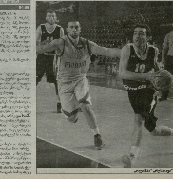
"ოლიმპი" - "რუსთა"