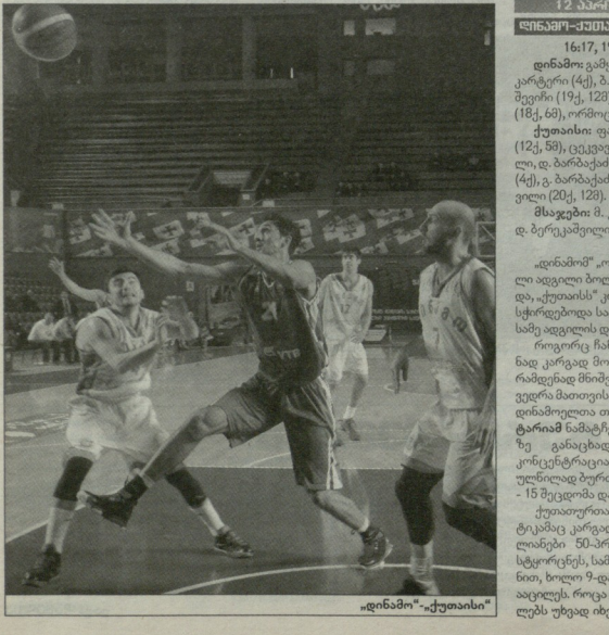
"დინამო" - "ქუთაისი"