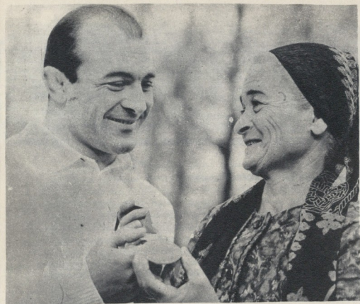
...ო, ოკრის მედალს...