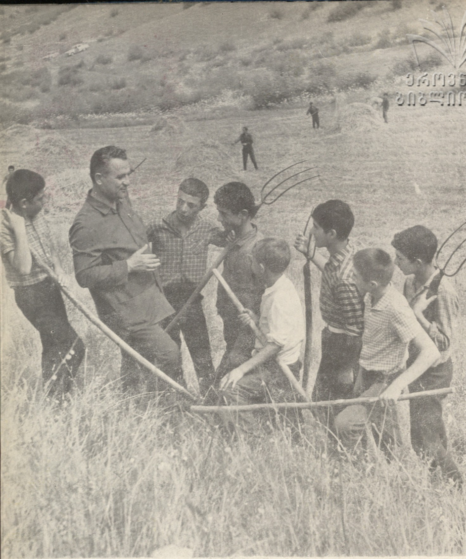
ნოდარის რაზმს რაიკომის მდივანი ესტუმრა (იხ. კრეპორტები ტარიანას მიწდგრემიდან).