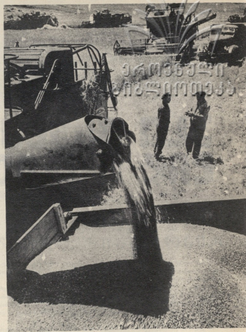
მისავლეს აღება ტროიანანზე