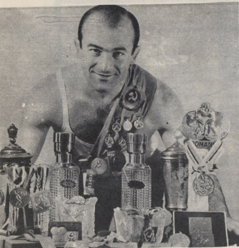
ამას უღებლობას ვერ უწოდებ...

იყო: „გულს ნო გატებით, რომანს სპორტში უველაფერი ზღვის ოქენს მარ ძლიერად და ტენიერად კიდაობთ, რომ ოცევი არ მძებარება, მეტისთვის მომბ ვალი ოლიმპიადის ჩემპიონი გახდებით!“