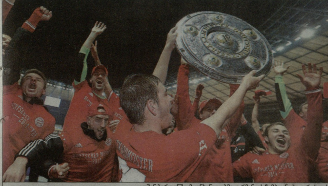
გუმინ ბერლინი: მიუნხენელებმა გერმანიის ჩემპიონობა ვერცხლის სინის ასლით იხვიეს. „ბაიერნი“ ნამდვილ სინს მოგვიანებით აღმართავს

ყველა დროის ყველაზე სწრაფი ჩემპიონობა და ზეიმი ლუდის გარეშე