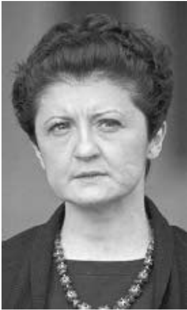
ურდლილოთა და ჩრდილიანთა შესახებ

— თქვენ ადგიშვილის ჩრდილის გაველენის ქვეშ იმყოფებითო, — უთხრა ოთო კახიძემ თვა წულუკიანს.