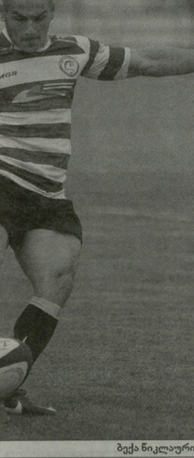
უბოსის მუშაობა გმარა კურბივი გაბიული