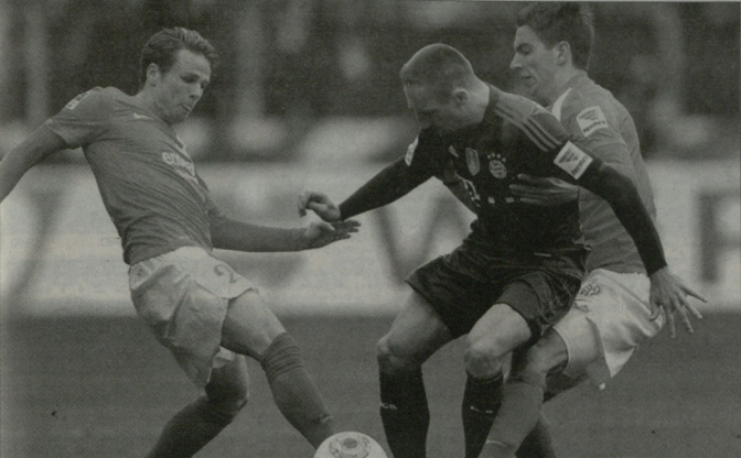
მანკელები მოწინააღმდეგეებთან წინააღმდეგობას უწევენ ფანჯრის ქვეშეშე ხომალდის მოედანზე (მარცხნივ) და კრისტოფორ კოლუმბოს ვარჯიშზე