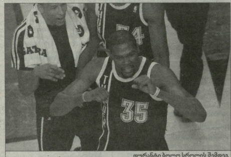
დარბაზი ბოლო სროლის შემდეგ