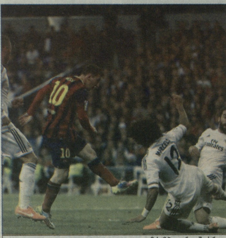
ლეი მესით შეი თრეკი შეპარულა

უბეტსაღვეფრთ თითქმის ერთი საათი დავილო. ყველაფერიც ბრანს როდრიგესის ხავედრებზე შეცვლა-ურევადლმა ნიდევი ბარიში ნე-უნი შეხზე მიიღო, რომ ნუნიში იო სან ხუნიუს გუნდამ ითლი და დიეგო სიმონეს კარცა გადამწვინი უბრალოებამ მოუგანა. რამდენიმე უთბოთი თავი დიეგო კომპანეც გადმირეს და მასაძინლებზე შეხვედრა გადამრესის ყველაბარი მასში მოუსია.