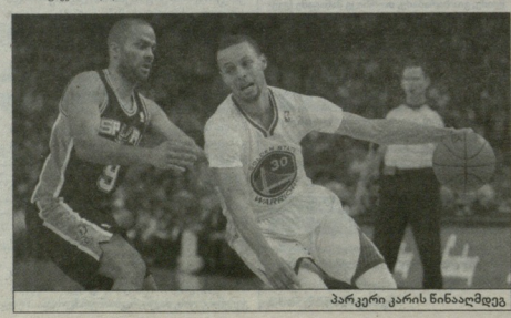
პარკერი კარის ნინამსმდე