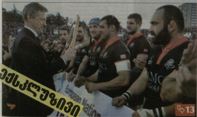
დიდი დროება სტუმროდ ბრიჯზე ბრუნდება