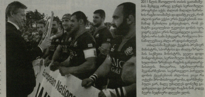
ოტავიანო მორარო საქართველოს ნაკრებს აჯილდოებს

- ხაგვასთან მიხედვით აღვინოთ, რომ 2011 წლის მოდერნიზაციის ვაგანთავილი მუშაზე ორივე ვუნდა სერიოზული პროექტი აქვს. ძალიან მაღალი ხარისხის რაგბი ითამაშეს და დაემატკიცოს, რომ ის ახლოს ვარგობა ექვსი ერის ქვეყნებთან. თამაშის ვაგანთავილი ვაგანთავილი, რომ ეს მამტი ვაგანთავილი უკეთესი დონის იყო, ვიფერხვით ექვსი ერის წინადაღილი ვაგანთავილი ორ-ამო მამტი ვეფერხვით მონაწილეობა ახლა არ ვაგანთავილი. თბილისში შევიტენგე ექვსი ერის პირველი მინისტრის, სპორტისა და ახალგაზრდობის საქმეთა მინისტრის, ყველა დიდი მონაწილეობით, სერიოზული მინაწილასხეულობით ზოგადი რაგბის განვითარებისთვის. მოგვიწავთ, სტალინური მანერა რუმინეთი. საქართველო პირველი დონის ქვეყნებთან ახლოსა. ვიცი რა თქვენი მონაწილეობა ვაგანთავილი, დამსახურებული ვარ, მალე უკეთესად დონეზე დაგვხვალთ და ქართველ რაგბის მონაწილე ბევრი ბედნიერი დღეები იქნება.