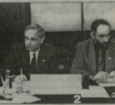
ჩვენ არ გვიწოდებოდა მანამდე რამდენიმე...