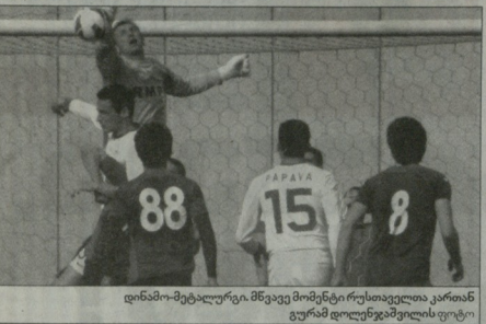
დინამო-მეტალურგ. მწვედ მომენტი რუსთაველა კართან ვერამ დღევანდელის ფოტო