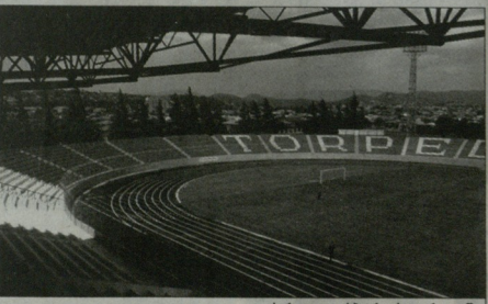
ზნით საქართველოს ჩემპიონატის ბოლო ტური გასტყუდა. ვერის ვერაფერი დაუმტკიცებია, და კონკრეტულად ვერაფერიც არაა დატყუებული.

15 მარტს საქართველო კიდევ ერთხელ დარწმუნდა, რომ ქვეყანაში სპორტის ნიჭირი პირველი სტადიონის სტატუსს რაზეც ეფუძნება წარმადობითი შეხვედრისას მხიერდების სახელობის სტადიონი გადაჭედლი იყო. და ეს ზუნებრივად იყო, რადგან რაზეც ვითარდება და „პირველისებრი“ საქართველოს მხოლოდ სიხარულს ანიჭებენ, ვრს ღირსებაში შედარების უღებები. ჩემგან მომდებარება ხაზისა თუ სპორტული აღად დაიშინებურის, ისინი სიხარულად სტადიონი და შეხვედრის გამოირჩევა, ერთმანეთს გატანა იყინა და, რაც მთავარია - სიმძინვე და ქართული რაზეც საბირთვიანი პოლიტიკა.