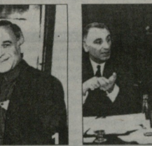
რეს. სამარია ხელმძღვანელი და ურთიერთობები...