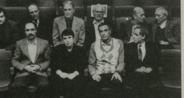
1989 წ. 6 ოქტომბერი. სოკის პირველადი დელეგაციის წევრები

„ლელო“ არა მხოლოდ ზემოხსენებულ პუბლიკაციით იდგა ქართული ფეხბურთის დამოუკიდებლობის სათავესთან, არამედ საქმიანად. 1989 წლის 26 დეკემბერს, სოკის შემქმნის გამოცდილების ვათალოსნიშნებით, საინფორმაციო ვაგონის მიოვლ საბუნოად ფედერაციის ცენტრალურ მდინაშა დავით კიკიაძეზე მინიჭდა ეს სხდომა ჩემი მონაწილეობით ჩატარდა, ორდროულად საკითხების დაკავშირებით უროდულად ვანაწმუნებდით უფრო დეტალურად. ფედერაციის უროდულად ვანაწმუნებდით უფრო დეტალურად. ფედერაციის უროდულად ვანაწმუნებდით უფრო დეტალურად.