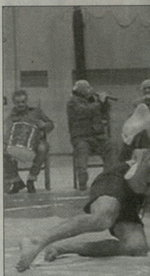
ქართული (დედა-მშობელი), 2. ვაჟი (1),...