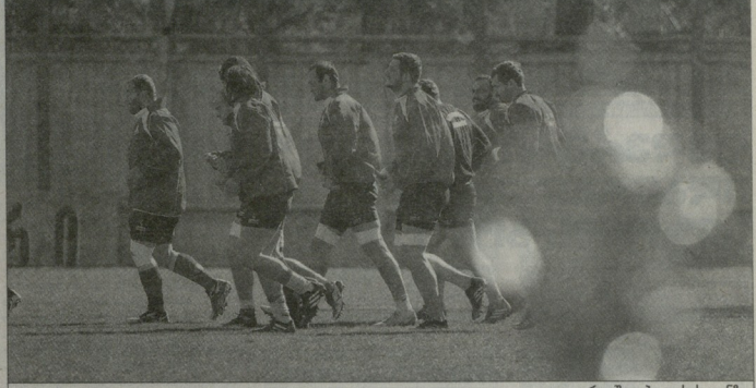
ღია ვარჯიში ვებ გელის ფონზე

საბრძოლველად ნაკრები ერთა თასის გათამაშების ბოლო ტურში ხელა ვაკეში რუმინეთის ეროვნულ გუნდს დაუპირისპირდება. „პირველად“ გაბარჯვების შემთხვევაში მსოფლიოს თასის შესარჩევ ტურნირში პირველ ადგილს დაიკავებენ და 2015 წელს ინგოლისში სასტრუქოდ, C ჯგუფში მონაწილეობენ. ამასთან ერთად, ჩვენი გუნდი ერთა თასის მსოფლიო დაჯილდოებას და ათმომხ მფლობელთა თასსაც თბილისში დატოვებს.