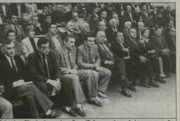
1989 წ. 6 ოქტომბერი. სოკის დამფუძნებელი კრების დელეგატები

უნდა ვიძევა, რომ ფეხბურთზე ხსენებულ წერილებს და მისი პაითოსად და კავშირებით სასტკ წინააღმდეგობას წაყნდით ჩვენი ვეტერანი ფეხბურთელებსთან. არავინ მათის გამოსვლისა გაისანდა ვანაწმუნობდით ვორკავა პრადედ ჩემს მისამართით. ძალიან მწაფეობა ამაზე ვუღო. ისინი ვერ ხვდებიდნენ, ან არ სურდათ გაეგოთ, რომ ეს სტინდებობა სამშობლოს და არ მარტო ფეხბურთის ინტერესისთვის. შეადგური გამაძისხილი: „ლექტის კომპარტისტი გამოაშეშეხებენ, რედაქციის გამაძისხილი და არ მოსკოლის ისეთი მწვევე ვაქცია მოსკოლო, როგორც საბჭოთა ფეხბურთიდან საქართველოს ფეხბურთის გამოაშეშეხებია“ - წერდა მსოფლიო პრესა.