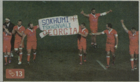
მატჩის ბოლოს „ბორჯომის გუნდმა“ გამოიტანა ბანერი სოხუმი და ცხინვალის საქართველო

2003 2007 2011 2015 გერმანია საქართველო მსოფლიოს თასზე!