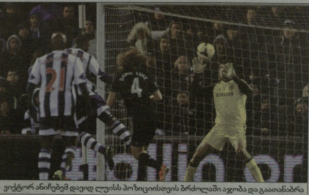
ფორტ ანიჩეზე დიდი ლუისის პოზიციისთვის ბრძოლაში ავიზა და გათანაბრა

მორიხოს თორიის ავ-კარგი... თამაშის მიზანსადაც, რაც უტკიავზე აქვთ რამდენიმე დღის წინ. მორიხოს მატჩის შემდეგინ დასკვნა, რომ მსხვერვალი ლიგურული შედეგით დასრულდა, სამართლიანი გვეჩვენება.