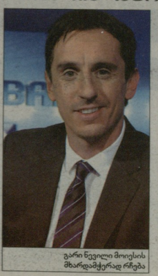
გარი ნევილი მოიგის მხარდაჭერად რჩება

2014 წელს მანჩესტერ იუნაიტედი... სულ 9 თამაში ჩატარა სეზონისგან ტურნირში. აქვანამ 3 მოიგო, 1 ფრედ თამაში და 5-ჯერ დაწრდა. სიტუაციის ამბავის ისიც, რომ უკვე იანჯერის მიხედვით, გამაგრდა ვერ ასეიციაციის თასიდან, შეეძლო ასი ლიგის თასზე მარცხე მიყოლია შეიძლება სერიაში. ასე რომ, სულაც არ არის გასაკვირი, რომ 50 წლის დევიდ ნოლოვის რიტენგი ისეთი დაბალია, როგორც არასდროს. გულშემატკივართა ირჩები, ვინც მოიგისთვის ერთი წლით კიდევ თითების წლითის გამოცხადებას, 73%-დან 51-მდე დეცია, 20%-დან 32-მდე გაზარდა მ მ ფანების ვრდუთი. ვინც სერვისის ბოლოს ითხოვს მოლონილითის გათვიზოვლებას. მუხლებად უწლის კონსისტენსია, კომპეტენსი მძიმე მხარდაჭერა მხოლოდ 17% ითხოვს მოიგის დაფერვებულ ვაშლებს.