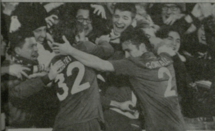
ასე იზეიმეს ფიორენტინელებმა „უდინეზეს“ კარი გატანილი მეორე გოლი