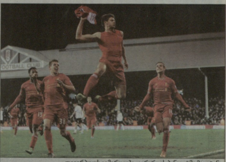
ლიგურულს გამარჯვება გერარდის პენსილტმა მოვტანა