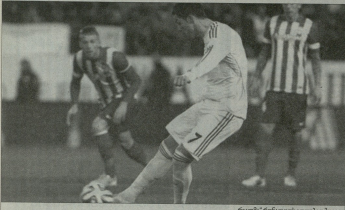
„რეალმა“ რომანლოს გოლები მოიგო