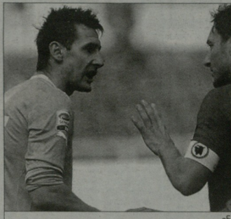
გნაბო, ვისი ავილეს