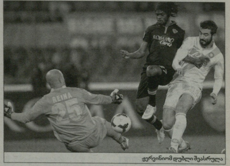
ფერინიო დელო მესარულია

მორეო ტიპში კი ნაპოლისელებს ეამოილდექს. თამაში ახალი განახლებული იყო, როდესაც გონსალო იფარინი მარცხენა ფრთხილად შეივარა მეტოქის საფაროებში და ჩანალო, ბურთი გაბნეულია მოგრან და სანტისმა კი საკუთარი კარი უმწიდა. ასეც ხდება, მეკარე ბურთის უმწიდა დაფრთხილად ხედავს მიზანს ვეგულს არასრულყოფილი მინარეთებმა შიტი. ამასობაში, დრის შერტეგსი ნაპოლისელებს იფარე ნინოლოლიანი და პანისი თამაში, რომელიც მატრის დარჩენილზე იფარე ნინოლოლიანი ფეტიერი კიდევ ანგარიში - ბოლოვლად მათთანგულად ვეგულს გაითიბებს, დასარტყმული პანიკაზე გვიდა და მეკარეს მახსი არ დატეგია. რომალის სასახლოდ დედა იტეგის, რომ არ გატეგნულ და გამარჯვების ხელების დასახედად დიდი მარცხის გონივინი, რამაც გამარჯვანი - 88-ე ნოტიუ მასპინძელმა სასახლოანი კომპანია გაითამაშეს; დასარტყმული პანიკიზეც ბურთი გაყვანის, რომელმაც მეკარი-