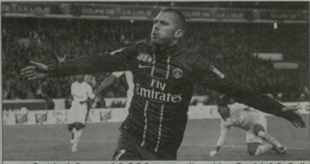
ინგლისური მედია ფერმი მენეჯიზი 'ლოვერპოლის' დირექტორებსზე წერს