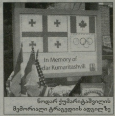
ნოდარ ქუმბარტაძის მემორიალი ტრაველიის ადგილზე