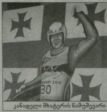
კანადელი მხტვრის ნამუშევარი