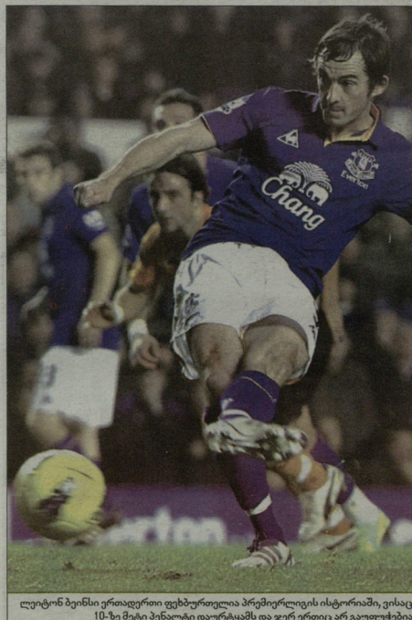
ლუიზო ბენის ერიავერთი ფეხბურთელია პრემიერლიგის ისტორიაში, ვისაც 10-ზე მეტი პენალტი დაურტყვამ და ჯერ ერთი არ გაუფუტებია

კვლევაზე მხრიად თვითმემტრინი ინიშნობდა შემდეგი ფუნდების კარნი: 1. სატონ ვილა 108 2. ტოტენჰემი 96 3. ნორუიჩი 91 4. ვესტჰემი 84 5. ლივერპული 84 6. ბლემინგი 79 7. ბრანფორდი 71 8. მანჩესტერი 67 9. საუთჰემპტონი 66 10. ჩალსი 65 11. ბარნლი 65