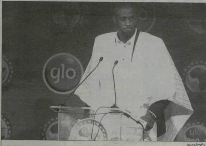
ია ია ტურე

„პოლან“ მომდევნო შეხვედრაში (2:0), ჩეხის გარდა კიდევ ერთი ოქტობერი იყო - ფრანსუა ტორესი გახდა მე-ოთხე უსაჩუქრესი ფეხბურთელი ჰავე რინასი, მიკელ არტატას და სესე ფაბრეგასის შემდეგ, რომელმაც პრემიერ-