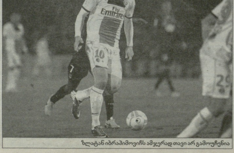
ზლანც იბრაჰიმოვიჩის ამჯერად თავი არ გამოუჩენია

როტაციას მიმართა ფიოინაც, ძირითად შემადგენლობაში გამოჩნდნენ მისი იმეტიანი წერტილი აბდრე ბოიერი და დიეგო როლანი. რაც მითავარია, სასტატისტიკო აბმონდრად გუნდის აბანდვეული გოიომ აარო. მასთან ყორობდებოდა აბლანსა-ბოთიანი კონტრაქტი გაფორმეს და ისიც კარგად იცით, რომ ააროს თაინბანეული სეზონი აქვს გაბატონებული სწორეცე-ში.