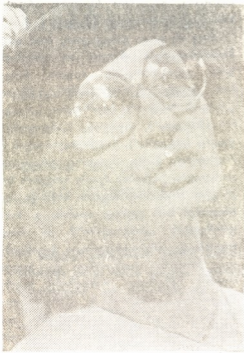
მერი პოპინსი — ზ. კვერენჩილაძე

მხოლოდ მხატვრულ გაფორმებად არ უნდა დარჩეს, დღეს ამაზე აღარავინ დავობს. მოზარდ მკვებებელთა თეატრის პატარა სცენაზე ორი გორგოლაჭიანი „ოთახი იდგა“, მარჯვნივ და მარცხნივ, შუაში რამდენიმე კარიანი, ისიც გორგოლაჭებიანი დანადგარი, რომელიც ხან ბანქსების სასლის კარი იყო, ხან — ალუბლის ქუჩა, ხან ბიძია ალბერტის სახლი, ხან კიდევ — ბანკის კარი. სცენის ხილვამეში კი კიბეებიანი აივანი, სადაც სამკაცციანი ორკესტრი იჯდა, — ასეთი ვარემო შეუქმნა ტრავერსის გმირებს, მხატვარმა და ეს სამყარო მკვებებლისათვის თბილი და ინტიმური გახდა. თამაშდებოდა აივანი, სადაც მხატვრის მიერ შერჩეულ კოსტიუმებში გამოწყობილი მუსიკოსები ისხდნენ, მსახიობები ამყარებდნენ მათთან ურთიერთობებს და ისინიც სპექტაკლის აქტიური მონაწილენი ხდებოდნენ. ჭეინის და მაიკლის ვარდისფერი კოსტიუმები, ყველა მონაწილის თითქმის ერთნაირი საღამური პე-