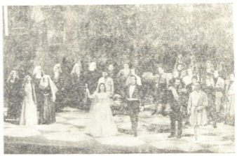
სენა სპექტაკლიდან „ჩრდილოეთის პატარძალი“.

ლიერი ერთობით კი გამონახულია ორი ერის სიახლოვე და ერთობა. მედალიონს ქვემოთ გამოლილა ამ ერთობის საყრდენი — საქართველოს მომხმბველი მიწა-წყალი, ცაში ატყორცნილი გუმბათებით, კიპარისებითა და რომანტიკული სივრცით. ყოველივე ამას კი მაგლაცუნად დასწოლია ნიკოლოზ პირველის სასახლის წრე, ფეოდალურ-ბატონყმური სამყარო, ფამუსოვთა, მოლჩაინთა, სკალოზუბთა და მშათა მისთა ხროვა... იხსენება ფარდა და ეს ბნელეთის მოციქულები ამოძრავდებიან: გრიბოედოვის პროგრესული აზროვნებით ბოლშევიკულნი და აღმფოთებულნი ხმამაღლა მოითხოვენ მის დასჯას და უსაზღვრო კმაყოფილებით ღებულობენ საგარეო საქმეთა მინისტრის, გრაფ ნესელროდეს ცნობას იმის თაობაზე, რომ მეფემ პოეტი სპარსე-