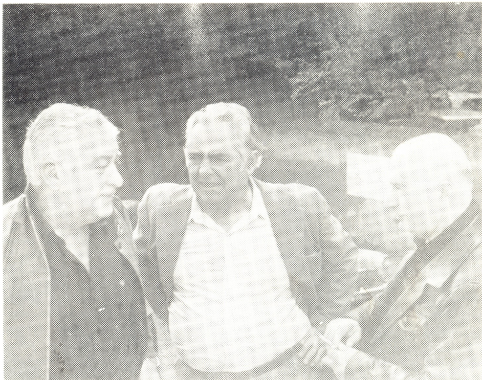
ყრილობის დელეგატა ერთი ჯგუფი.

აღრე სცენაზე შემოსულ მსახიობს ხუთი წუთის შემდეგ ძლივს იცნობდა მაყურებელი, რა იყო ამაში ცუდი?