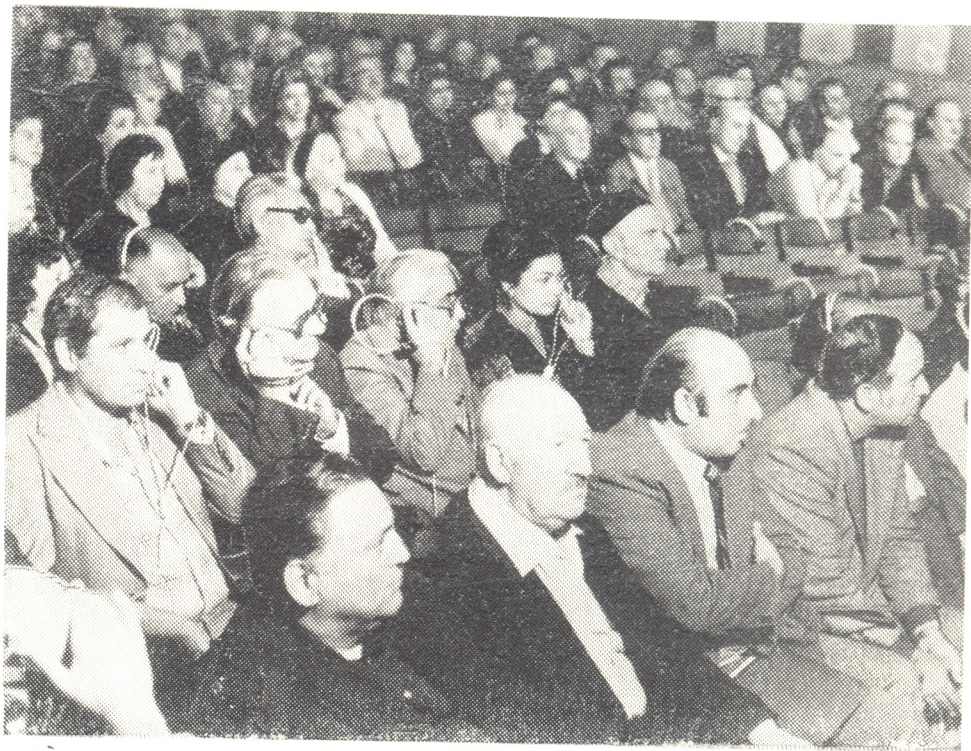
ყრილობის სსლომათა დარბაზი

— მართალია, ადგილებზე გამართულ წინასაყრილოო კონფერენციებსა თუ პლენუმებზე ჩვენ შევეცადეთ ავად თუ კარგად გვესმეკელა თეატრალური ცხოვრების საქირბოროტო საკითხებზე. პრობლემებზე, თქვა მან. — მაგრამ ყველა ჩენის მთავარი სათქმელი მაინც აქ იყრის თავს. აქ მოითხოვს პასუხს, ჩენს მთავარ თავურლომაზე. ამიტომ უმჯობესი იქნება თუ არ გამოვეკიდებით წვრილმანებს, გვერდზე გადავდებთ პირადულს თუ პატივიოყვარულ ემოციებს და მსჯელობის საგნად გავხდით საერთო სატიკვარს, რაც აწუხებს და აღელვებს ყველა თეატრს. ბათუმშიც და თელავშიც, სოხუშიც და რუსთავშიც, ლიხს გადაღმაც და ლიხს გადმოღმაცო. იგი ეხება პერიფერიული თეატრების შემოქმედებითი მუშაობის რთულ პირობებს, განსაკუთრებით კრიტიკულად განიხილავს გასვლითი სპექტაკლების სისტემას, მიაჩნია, რომ ეს გასვლითი სპექტაკლები მორყეული ავტობუსებით, განახევრებული დეკორაციებით, შემცირებული პერსონაჟით, მბუჟუტავი განათებით, გაყი-