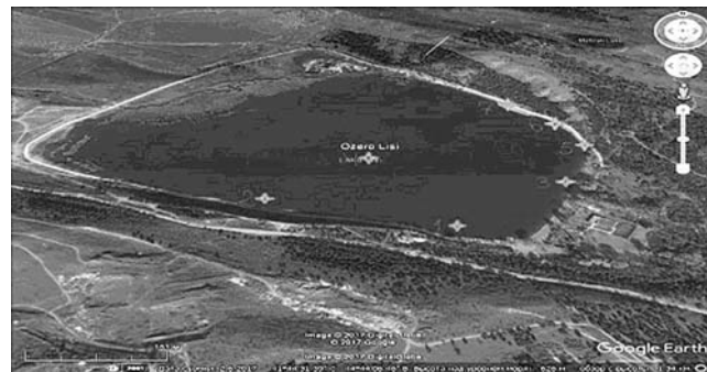
ნახ.1. ლისის ტბაზე შერჩეული დაკვირვების წერტილები

კვლევის პროცესში, დაკვირვების წერტილების შერჩევის შემდეგ (ნახ.1), ჩატარებულია ოთხი ექსპედიციური გასვლა, აღებულია 13 საანალიზო ნიმუში, გამოყენებულია აგრეთვე გარემოს ეროვნული სააგენტოს მონაცემები [5].