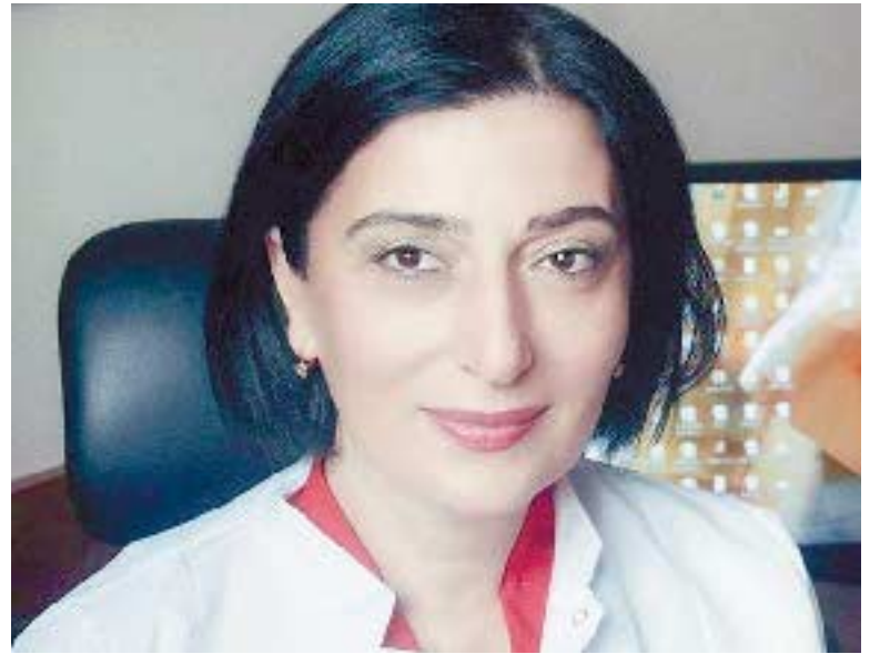
ნებისთვის ორგანიზმის ე.წ. კრიტიკული პერიოდის — კლიმაქსის სინდრომის შეგავლენა.

— ქალი მამაკაცთან შედარებით ფიზიკურად სუსტი არსებაა. ცხოვრების პირობები, ემოციები, სტრესი მის ჯანმრთელობაზე უარყოფითად აისახება. განსაკუთრებით რთულია ქალბატონებისთვის ორგანიზმის ე.წ. კრიტიკული პერიოდის — კლიმაქსის სინდრომის შეგავლენა.