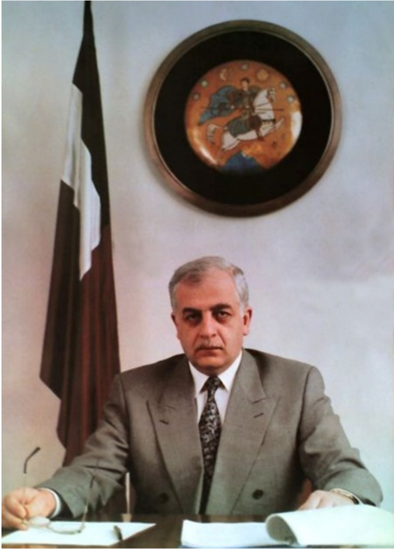
ზვიად გამსახურდია - 80