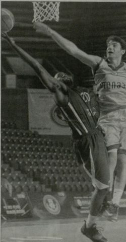
მერაზ ბოქლიძე გიმნაზიტი და ცირ...