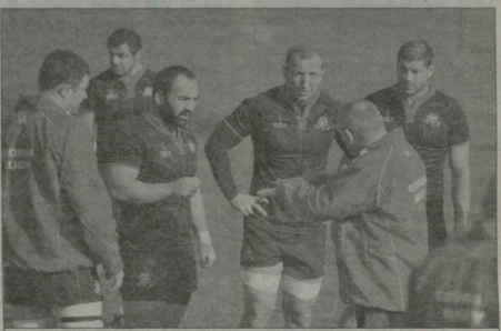
დიდი ბესი შორკინაღობს მითითებებს აძლებს