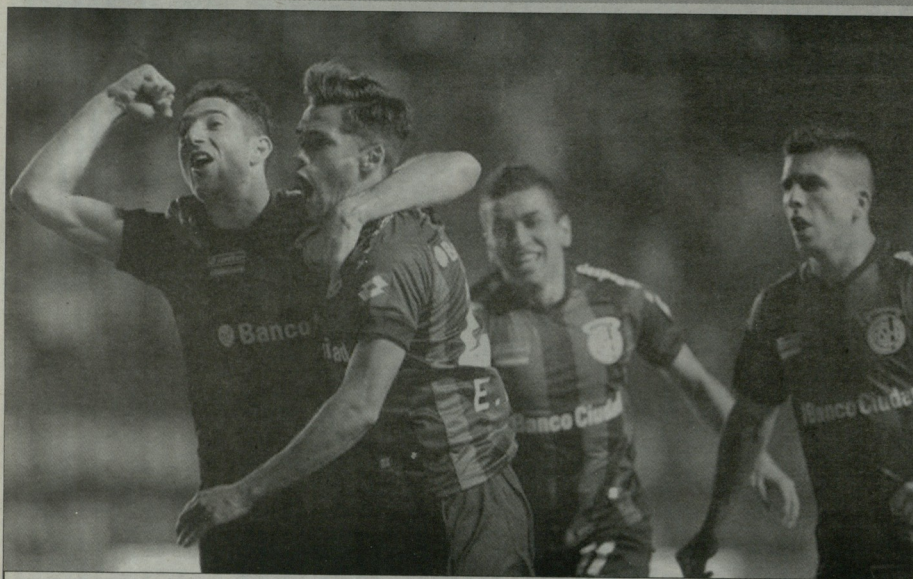
მატი და კორეა „სან ლორენსოს“ შორეულ გულს აღინაწვინა