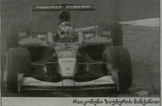
რაიკონენი ზაფხულის მანქანით