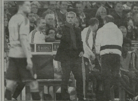
ქოზო მორინის „მალეკსიან“ ნერვიულობის საბაზი არ მისცემია