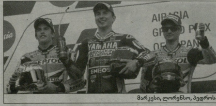
მარკეტი, ლორენსი, ბეკინი