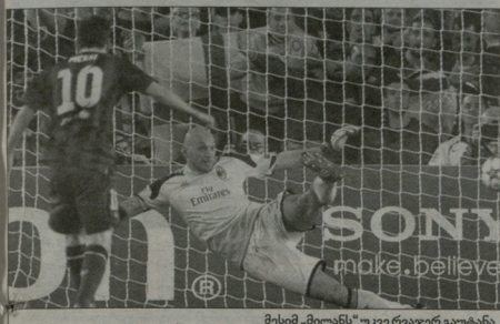
მესი, მილანის უკვე რვაჯერ გაუტანა