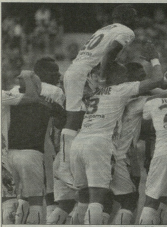
„პორდო“ ნიცის კრისის დაიწევა