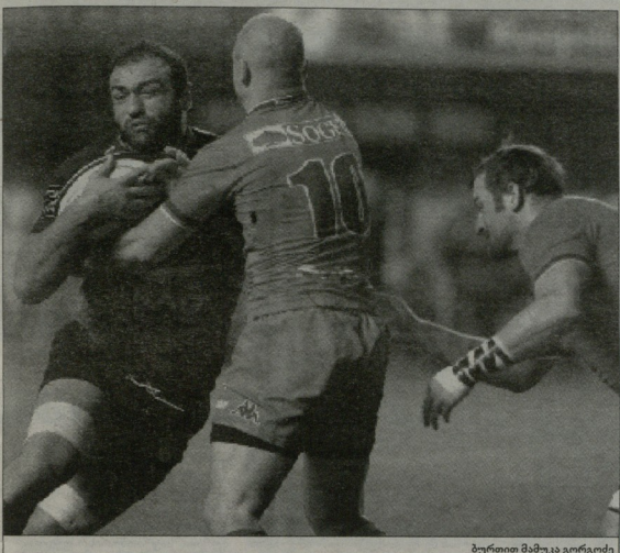
ბურთით მამაც ღრუბოცი