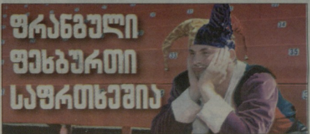
საფრანგის საფეხბურთო გაფიჭვი ელის

ფრანგულ ფეხბურთში მაროლივ საფრანგული მიგრობაობა. ვიამბოია საფრანგული პრეფესიონალურ საფეხბურთო კლუბის კაპიტანის გენერალური ასამბლეა, რომელზეც კატეგორიულად გადაინაცვლებს - გაფიჭვი თუ რამდენ ცვლილებებს არ იქნება, 29 ნოემბრის 2 დეკემბრის ჩარდითი ლიგა 1-სა და ლიგა 2-ში ჩასატარებელი შედეგდებიტი არ გამიბრება, რადგან ფეხბურთილი მიმდროზე არ გაველი. საფრანგული რეველუციები ცნობილი და მათ შორის ფეხბურთი, უკან დახედვის, მაროლივ ჩანს, არაფერ ამირებს. ამ მიზნობრივს სახელი და სლოგანი შეეძლება ერთად. აღებურთი საფრანგული დევეტი კრავლდ. საფრანგული პროფესიონალურ კლუბის კაპიტანი ფიჭვის ატეხურთის, ცეც მიიღებს.