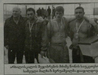
არხილისკალის მუშაობის მიმდინარეობის სურათი