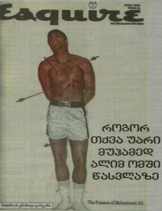
Esquire-ის ცნობილი გარკვენი