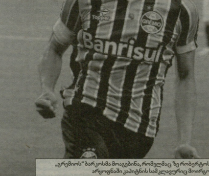
„გრემოსი“ ბარკოსანს მოავტანა, რომელმაც ზე როზერტოს არჩვენაში კაპიტნის სამ კლავურეც მოიგო

ბაიონი-პარიზი 13 - დენსონი (ბლანტი-კარანდისი 14 - ლუბრეტი (მონტეპერა-ბაი), ვალანსი (სანტ ტრენენსი); 11 - ფრანკო (კო-