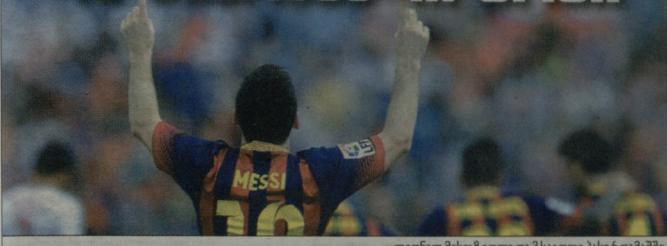
ლიონელ მესი 8 გოლი და 3 საკლეო პასი 6 თამაშში

სანკარში პარსის დადგომისაზე ვერონის ხოთი სპეციალისტებისგან კონკრეტული მიზნების დადგენა და მათი სანდგონის სტრატეგია გაგავაჩინო. პლა დროა, ფეხბურთელთა რეიტინგი და სტატისტიკა შემოვიტავო.