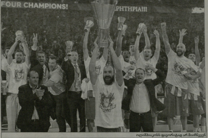
ოლიმპიკოსის ფაორტირად არ მიიწინევენ

ამეც ვაფორული დიდ ინტერესს იწყებს „დენერბაშის“ გამოხლა. მის ლეგენდარული ველეო ზამბონის ჩაყვდა სადავად. ევროლიგის ურესს მის განმარტებულ მწირობებსა ერთი წელი და ისვენა და ახლა თურქულია მთლილი ამ მთლიან ორწინული კონტრატტი, არამედ შევადგენლობის საკმეო სტრორული გადამტრება. შვიძინის ცვლასთვის კარგად ნაყენი ნენინია ჰილცი და ლონს კლუბა. ეს საკმეო კარგი დამატება ბო მკალებლისთვისა და მთიან პოგდაწოჩისთვის.