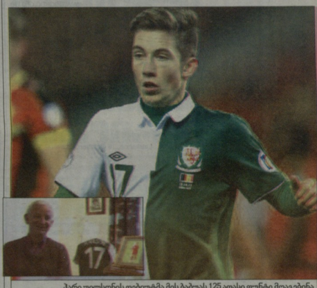
პარი ულსინის ფეხბურთის მისი ბაბუა 125 თასი ფუნტი მოაგებინა