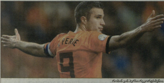
რობინ ვან პერის რეკორდსმენი