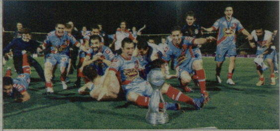
„არსენალ“ ისტორიაში მეორე გუნდია, ვინც არგენტინის თასი მოიგო

შეგახსენებთ, რომ არგენტინის მიმდინარე ჩემპიონატი „არსენალს“ მერვე ადგილზე და ერთადერთი დამარცხებული გუნდია. მაგრამ სარანდელუბს და გულბოლიდურ „სან ლუისი ჩამორჩება და გულბოლიდურუბის მხრიდან მასის მარჩობებს.