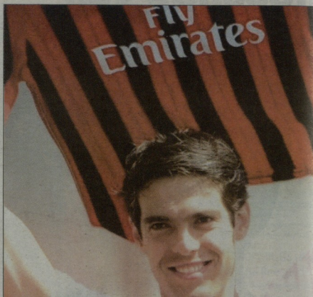
კაკა შესაძლოა „ვალუენტინო კორსოის“ ითამაშოს

მიუგანმრთელად, მალე სრული დატვირთვით ივარჯიშებს და მთავის შეხვედრის 15-20 წუთით ითამაშებს. თუმცა, შესაძლოა „მილანი“ მწირობელებზე არ გაროს კინ და კაკა ჩემპიონალოგაზე „პარალელისთან“ პაუერისთვის შემოინახოს. თავად კაკა „კაბეტა