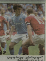
დავით სილა „ეტაპიდან“ ნახლას არ ვეგმავს

საკუთრება, თუმცა ვალუენტინო პრაზილილი დიროფის არაფორი სურს ბუქების ლუქისმანზე ხარკიკდება.