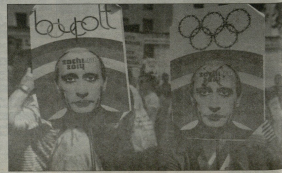
პეკინი მომუშადათა თამაშებიში