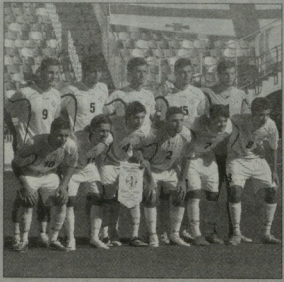
რაც მოხდა, უკვე ჩაგლივს ამბავია და ამავე დროს - გუნდის სასარგებლოდ. ახლახან, „ლელო“-მ აღუქვანდრი ამისულოდელს რომ ჩამოიარა ინტერვიუ, კრიტიკულ ნაკრების მეცხვსა კიბორთა არ ნიშნავს აკერ შედეგი უნდათ და გერე ყველაფერი, შეგრძამს არ ხდება...