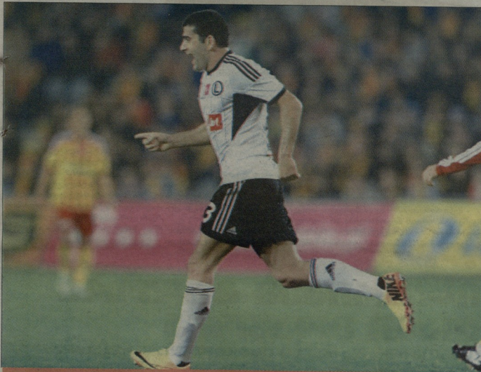
ქართული ლეგიონის მონაგარი უკვეაზა 2,4