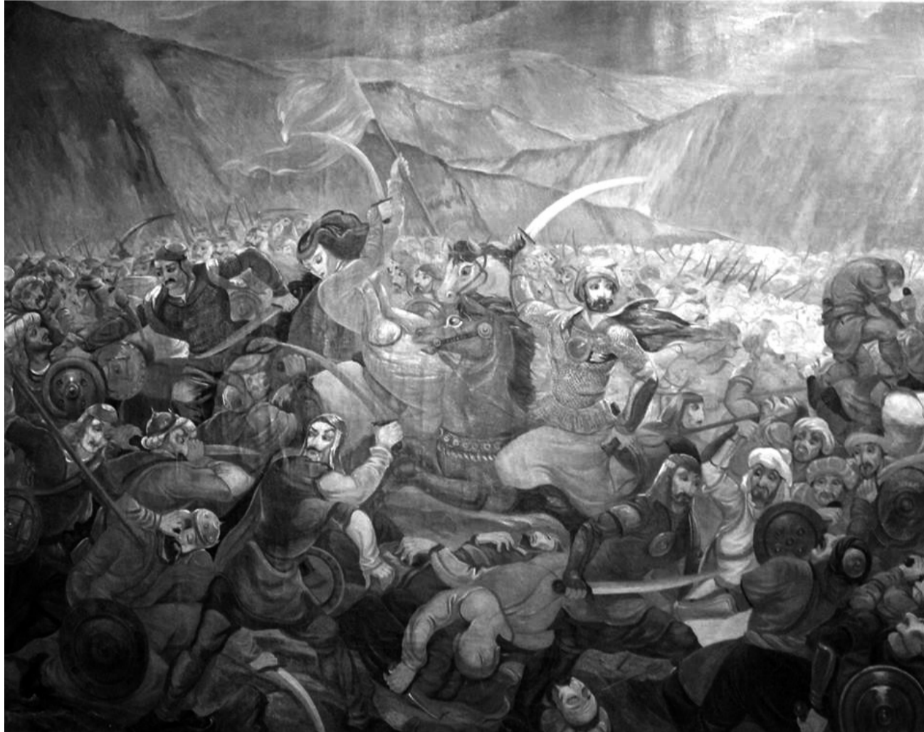
ლადო გუდიაშვილი. „ტაშისკრის ბრძოლა“.

ვიციოთ, ვახუშტის მიხედვით, ქვიშხეთი სად მდებარეობდა.