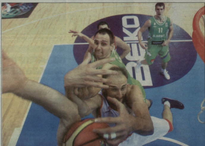
ფარკემ უზღავაეთო ბროლა მიმდინარეობდა

განმლი: 27/61, 44.3, 19/34, 52.9, 9/27, 33.3, 9/17, 52.9, 10, 25, 35, 12, 14, 5, 3, 27, 21, 72