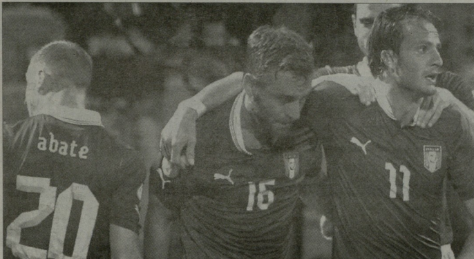
იტალიის ნაკრები ჩემპიონატის მსაჯულად მუშაობდა მუნდიალზე