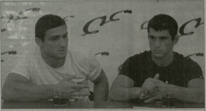
ავსტრიელი ლობკოვიჩი (მარცხნივ) და ავსტრიელი ქვიციანი