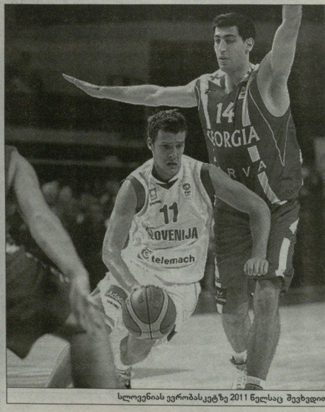
სლოვენის ევროპის ეტაპზე 2011 წელსაც შეხვედრა