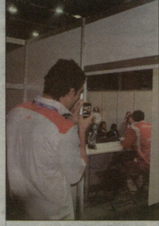
2011 წლის ევროპასკების ბოლო მატჩის (საქართველო-საბერძნეთი 60:73) საბრესკობერენციო დარბაზის კართი. - მეთრეულმა ივორ კოკოპოვმა პრეკორდული შედეგით გიორგი შერბა დიდი იაეტრუკის მიხედვით მთავრული სეზონისთვის შესავსე ლეკვენივი დადიოდა. მანქანურებდა, უკრაინელებთან როგორც ილაბარებდა და მასში ხელიდან არ გავეშუე.