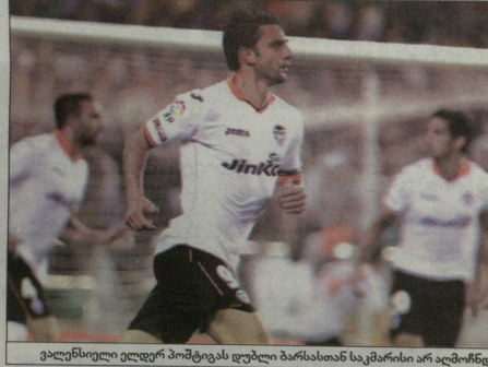
ვალდისი ლედერ პომტეას დულბი ბარსეოსთან სამკერნაიმ არ აღმოჩნდა