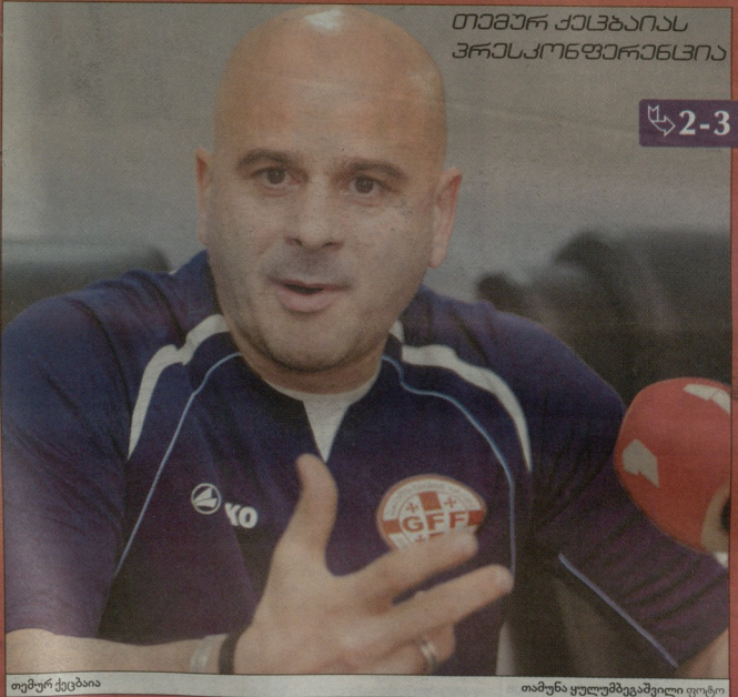
თამარ ქაცხაიას პრეზიდენტის პრესკონფერენსია

...ადრე ნაპრაზში 16-17 წლის ბიჭებს იმისთვის ათაბაზუხანე, რომ გაეხილათ