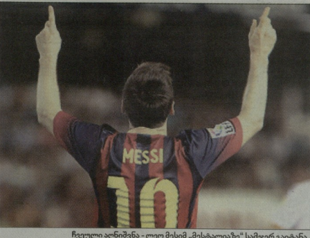
ჩვეული აღნიშვნა - ლეო მესიმ „მესტალიაზე“ სამჯერ გაიტანა