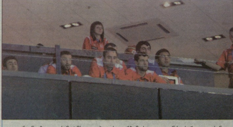
უკრაინა-ბელგის მატჩის კლიპიდან დარბაზის ლოფიდან საქართველოს ნაკრები გულსიყურით იდევრება თვლს. რატომ? ზაზას მოუღმინოთ: - თუ უკრაინელები გამარჯვებულდნენ, მომდევნო ეტაპზე ჩვენ გავედვლით, ხოლო ბულგარელები წარმატების შემთხვევაში ვას ბულგარეთი განავრძობდა. უკრაინელებმა ივაცკეს და მატჩის ბედი მეთრე პერიოდამდე გადავიწყიტს. ლოფში, ჩვენს ქვემო ბულგარეთის ნაკრების კალათბურთელები ისხდნენ და ბელგისა გულშემატიკრობდნენ... მათ მეთრე პერიოდის დასაწყისშივე დატოვეს ლოფა.