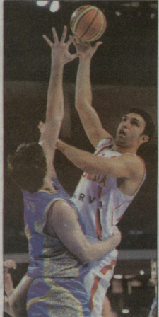
ევროპის 2011 წლის ჩემპიონატზე საქართველომ ბერლინის მოედანზე დიდი სხვაობით აჯობა უკრაინის ნაკრებს - 69:53. - მასხვს, ამ შეხვედრაში ქულამოხსნა უზად არ მქონია, მაგრამ ბუკური ეპროშივე და სწორედ უკრაინასთან დამაჯერებელი გამარჯვებით გავიდეთ მეთრე ეტაპზე.