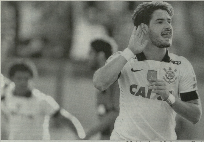
ალფანდრე პატომო "ფლამინგო" ირეკრ დაამწურხა