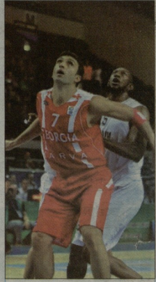
2010 წელს შესარევე მატჩში თბილისში ბელგისთან 23 ქულის სხვაობით დავმარცხდით. 2011-ში ვევი, ევროპასკების გახსნის შეხვედრა ქართველებს სწორედ ბელგისთან ჰქონდათ და რეგამშიც მუცა - 81:59. - ამ ფოტოზე დიდი მუცაზე ვეკამაშობ. იგი წლების განმავლობაში NBA-ში გამოვლდა. არავრებულ მთაქვამს, რომ ევროპაში კლამბურელების წინააღმდეგ გამოსვლა, როდესაც NBA-ს გამოვლდებოდა აქეთ, ჩემთვის სასამოფოვია და დამტებით სტამბულე, კარგად დავმთვებ: ევროპის 2011 წლის ჩემპიონატზე მთავრული მატჩი ბელგისთან ვივამაშეთ და სწორედ ეს გამარჯვება აღიზინდა გადაწყვეტი მომდევნო ეტაპზე გასვლის საქმეთა.