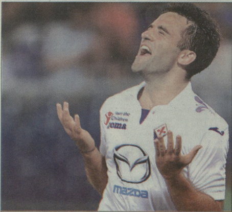
ჯუზეპე როსი „ჯენოასაც“ გაუტანა

კალჩო არც ისე უინტერესოა, როგორც ბევრს ჰგონია