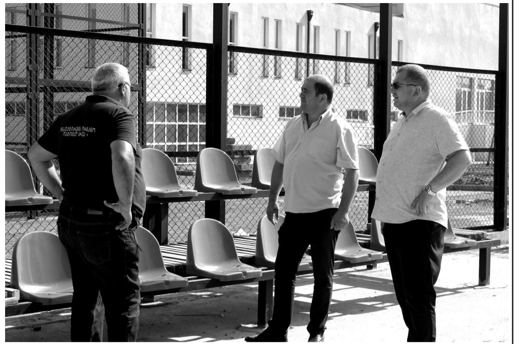
ინტენსიურ რეჟიმში მიმდინარეობს. პროექტი, რომელიც თანადაფინანსებით ხორციელდება, 538 965 ლარს მოიცავს და მიმდინარე წლის ბოლოს დასრულდება. თანამედროვე სტანდარტებით მოწყობილი შენობა სკოლამდელი აღსაზრდელებისთვის საუკეთესო პირობებს შექმნის.

ხაშურში, „მინის ტარის“ დასახლებაში №8 საბავშვო ბაღის მშენებლობა