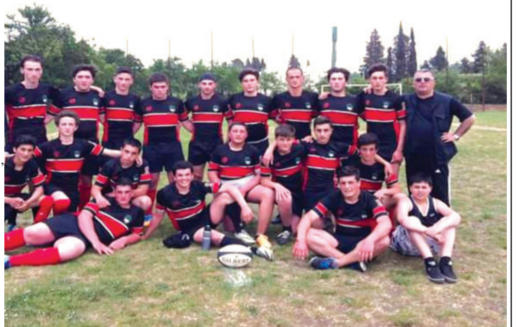
სურვით „მგლებს“. იმედია, მათი მიღწევების შესახებ, კიდევ ბევრჯერ მოგვიწევს წერა.

დავუცადოთ მოვლენების განვითარებას და წარმატებები ვუ-