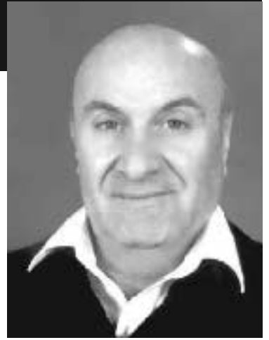
ლონისძე ბიძინა უნდა იფიქროს

ზოგიერთებმა რომ არ დამწამონ რაიმე — პირადული ინტერესი, მსურს თავშივე განვაცხადო, რომ პირადული არ გამოძრავებს, არც მკვირვარობა და არც პროპორციულობა, არც პოზიციონერობა და არც თაბაშირის იდეოლოგი გახლავარ. ჩემი „პარტია“ სამშობლოა, ინტერესი კი ქართველი ერის გადარჩენაა! ჩემი ლოზუნგი (დღევანდელი გაგებით „სლოგანი“), არაერთგზის მითქვამს და გამბობ: საქართველო, ქართველი ერის სულიერი და მატერიალური სამკვიდრო მსოფლიო ცივილიზაციის საგანძურში და იგი მარადიული უნდა იყოს! განვიღო სამ ათეულ წელში ქართველი ერი დაეცა სულიერად და გადატაცდა მატერიალურად. მაგანთა ქუჩის ცრუ იდეებითა და დაპირებებით იკვებება. დაიშა ერი და, ფიზიკური გადარჩენის მიზნით, მსოფლიოს ათეულობით ქვეყანას მიაშურა. სად არ ნახავთ დღეს ქართველს — ავსტრალიაში, აფრიკაში,