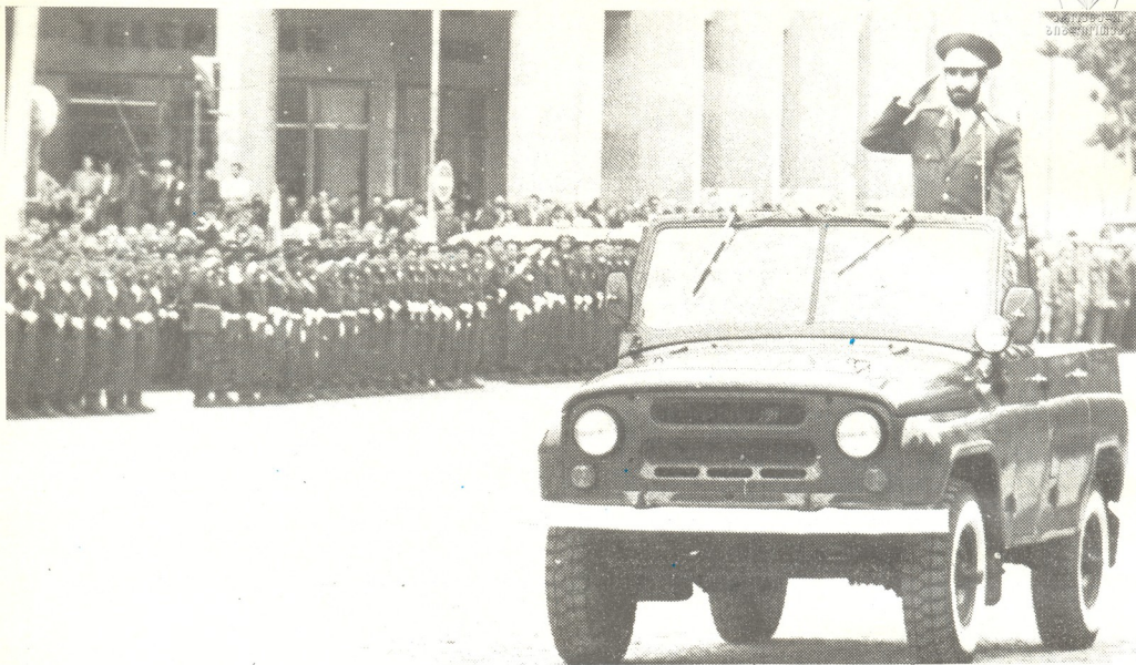
თბილისი. 26 მაისი. ჩანაუვლიკის მოედანზე.