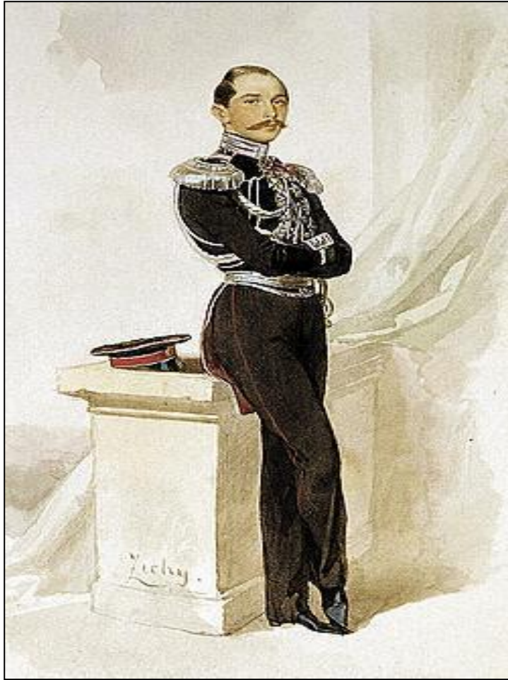
ახალგაზრდა პეტრე ბაგრატიონი

რა შედეგები მოჰყვა ამ საინტერესო და მნიშვნელოვან აღმოჩენას? თანამედროვე მეტალურგია დღესაც ფართოდ იყენებს მადნიდან ოქროს მიღების ციანურ პროცესს, მაგრამ მოხდა სამწუხარო ისტორიული უკუღმართობა. ნახევარი საუკუნის შემდეგ 1894 წელს ბაგრატიონის ცნობილი მეთოდი ოქროს მიღების შესახებ რუსეთში დაბრუნდა მაკ-არტურისა და ძმები ფორესტების სახელწოდებით. ხოლო რამდენიმე