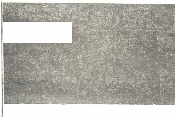
წინა პირი (შავ-თეთრი გამოსახულება)