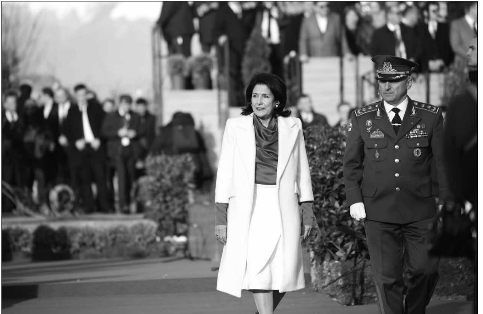
საქართველოს პრეზიდენტი სალომე ზურაბიშვილი ფიხის დაღვას შემდეგ ქართველ ჯარისკაცებს მიხალმა

თუმცა დამოუკიდებლობის აღდგენით დავებრუნდით ევროპული სახელმწიფოს მშენებლობას, დღეს ჩვენს წინ ისევ ვადაწვევები ეტაბია.