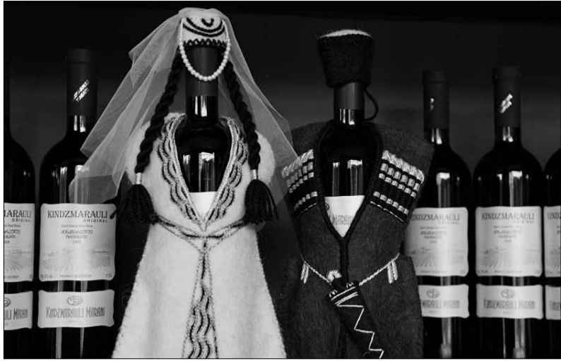
ზეა აღმოჩენილი. ვაშინგტონში გამართულ კონფერენციაზე ქართული ღვინის მ-ათასწლიან ისტორიასთან ერთად,

კონფერენცია აშშ-ს სტრატეგიისა და საერთაშორისო სწავლების ცენტრში (CSIS) გაიმართა იმ მეცნიერების მონაწილეობით, რომლებიც უშუალოდ იყვნენ ჩართული ღვინის ეროვნული სააგენტოს პროექტში „ქართული ვაშისა და ღვინის კულტურის კვლევა“. აღნიშნული პროექტის კვლევების საფუძველზე, 2017 წლის 13 ნოემბერს, აშშ-ის მეცნიერებათა ეროვნული აკადემიის სამეცნიერო ყურნალში (PNAS) გამოქვეყნდა სამეცნიერო სტატია „საქართველოს ადრეული ნეოლითური ღვინო სამხრეთ კავკასიიდან“, რომლითაც დასტურდება, რომ მეღვინეობის უძველესი კვალისწორედ საქართველოს ტერიტორია-