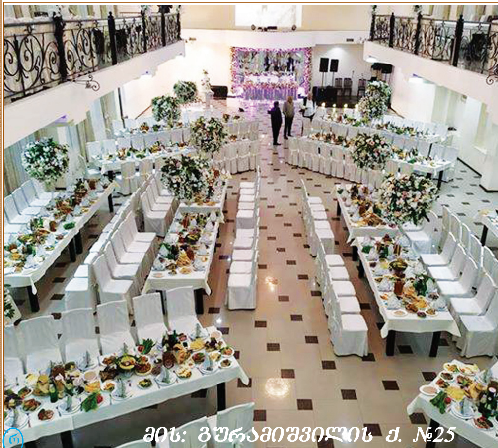
მის: გურამიშვილის ქ. №25