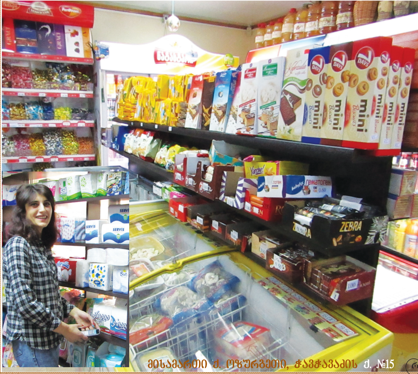
მისამართი ქ. ოზურგეთი, ჭავჭავაძის ქ. №15