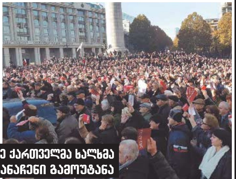
25 ნოემბრის აქციაზე ქართველმა ხალხმა „ნაცმოძრაობას“ განაჩენი გამოუტანა