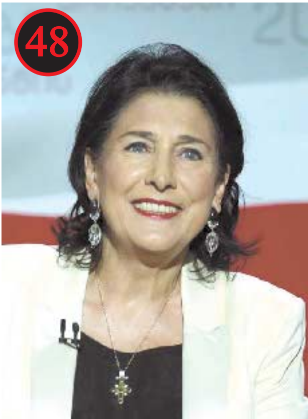
სალომე ზურაბიშვილი — 64 %

სოციოლოგიურმა კვლევამ, რომელიც კერძო პირის შეკვეთით განხორციელდა, იმდენად სენსაციური შედეგები აჩვენა, შემკვეთმა, არაჯანსაღი წინასაარჩევნო აჟიოტაჟის თავიდან აცილების მიზნით, შედეგების გასაჯაროებაზე უარი განაცხადა.