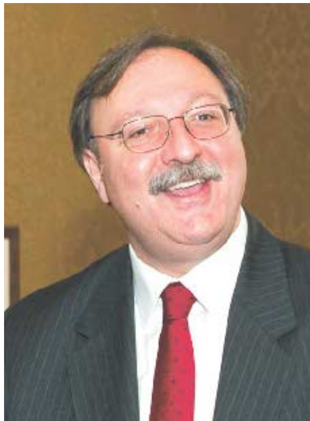
გიორგი ვაშაკიძე — 36%

ვაშაკიძის გაპრეზიდენტება თვითმკვლელობაა ქვეყნისთვის, სალომე ზურაბიშვილის გაპრეზიდენტება – გადარჩენის და სიცოცხლის გაგრძელების გარანტი