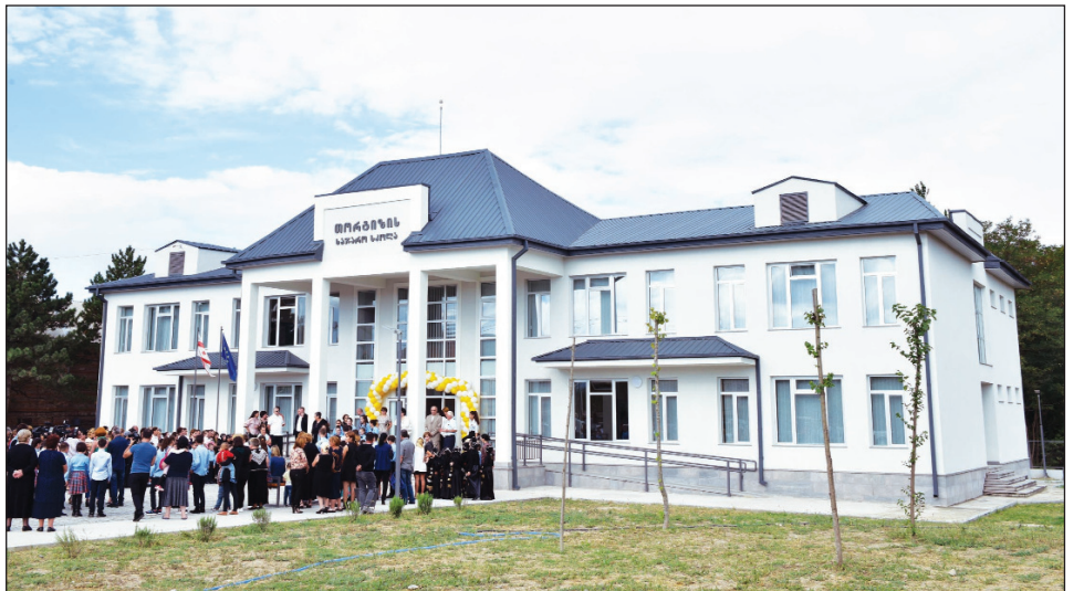
ფასიანი პოლიტიკური რეკლამა