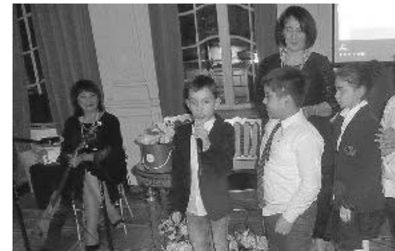
გაიმარჯვებდა, აბა, არა?!