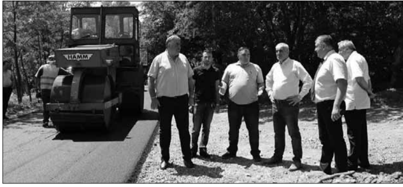
მუნიციპალიტეტში უახლოეს პერიოდში სასმელი წყლის მაგისტრალის მოწყობა იგეგმება სოფლებში: ზედა სიმონეთში, სიქთარვასა და ბარდუბანში, ასევე ქალაქში ჯაბიძის ქუჩაზე. 2018 წელს თერჯოლაში 16 მასშტაბური პროექტის განხორციელება იგეგმება.

იმერეთში სახელმწიფო რწმუნებულის-გუბერნატორის მოვალეობის შემსრულებელმა გრიგოლ დალაქიშვილმა და თერჯოლის მერმა ბონდო სოფრომაძემ მუნიციპალიტეტში მიმდინარე დასრულებული ინფრასტრუქტურული პროექტები დაათვალიერეს. ამ ეტაპზე თერჯოლაში რამდენიმე სოფელში მისასვლელი გზისა და დაზიანებული საყრდენი კედლების სამუშაოები ხორციელდება. მონიტორინგის ფარგლებში გრიგოლ დალაქიშვილი გოდოგანი-ნავარევი-ბროლისკედლის დამაკავშირებელი გზის, სოფელ ეწერისა და რობაქიძის ქუჩაზე მიმდინარე საგზაო ინფრასტრუქტურის მოწყობის სამუშაოებს ადგილზე გაეცნო.